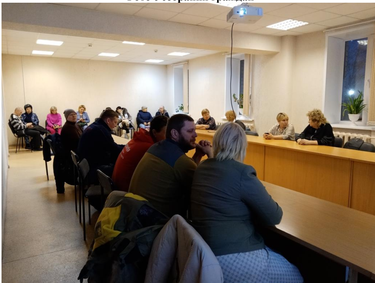
Фото с собрания граждан